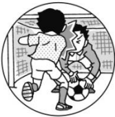
接触プレーで激突