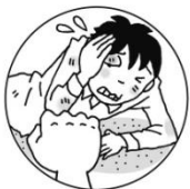
けんかであられた