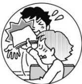
プリントの角が目