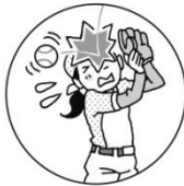
キャッチボールに失敗