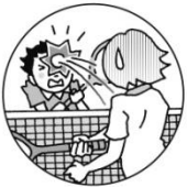
スマッシュが当たった