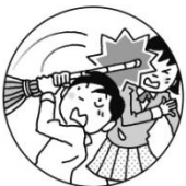
振り回した棒が直撃