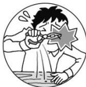
ペンチで釘を抜こうとして